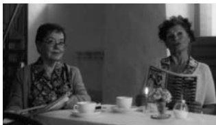
MUSICSTORIES - JE TE VEUX