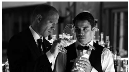
MEIN BLINDDATE MIT DEM LEBEN