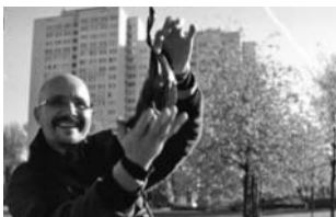
THE ART OF AUTHENTICITY