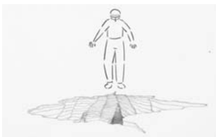
MIND THE GAP