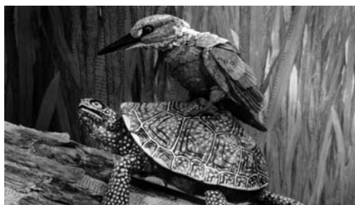
BONJOUR LE MONDE

Im Laufe dieses Programmes geht dann auch die Awardsaison 2025 mit den Oscars in Los Angeles zu Ende. Wir schulden unseren Zuschauer*innen auch noch ein "Best of 2025" und liefern das hier noch nach. Bei der Auswahl haben wir nicht einfach nur unsere Lieblinge herausgesucht, sondern auch bewusst einige Kandidat*innen ausgewählt, die das saarländische Publikum vielleicht verpasst hat, oder kaum bzw. gar nicht im Original mit Untertiteln bei uns gespielt wurden. Dies war zum Beispiel bei Joachim Triers SENTIMENTAL VALUE der Fall, den man bei uns mehrmals im schwedisch-englischen Original mit Untertiteln sehen kann. Auch der wunderschöne, oscar-nominierte Animationsfilm MEMOIREN EINER SCHNECKE ist bei uns mit den Originalstimmen von Rocklegende Nick Cave und SUCCESSION-Star Sarah Snook zu sehen. Auch das Wüstendrama SIRAT und der iranische Palme-d'Or-Gewinner EIN EINFACHER UNFALL sind mit dabei. Wer es etwas leichter mag, der hat noch einmal die Chance, Wes Andersons DER PHÖNIZISCHE MEISTERSTREICH im Kino zu genießen.