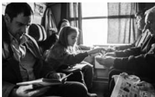
DER MANN, DER NICHT SCHWEI- GEN WOLLTE